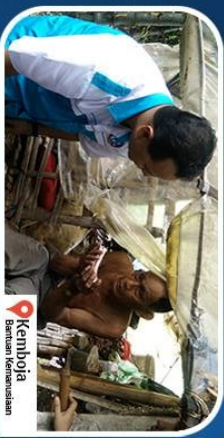
Kamboja Bantuan Kemasyarakatan